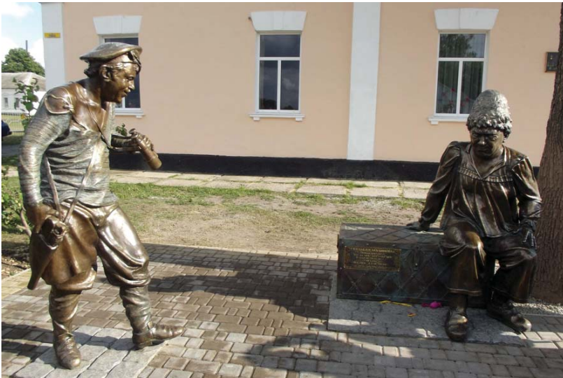
Бронзовый Попандопуло появился в Малиновке